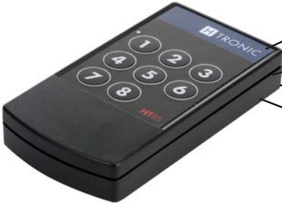
Sender Typ HT 8 S Art.Nr.: 1618180

Der 8-Kan. Sender kann an beliebig viele Empfänger angelernt werden.