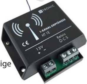
Empfänger HT 1 E Art.Nr.: 1618260

Belegung Empfänger Kan. 1., Taste vom Sender frei wählbar