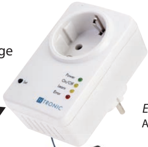
Empfänger HT 1 EPP Art.Nr.: 1618150

Belegung Empfänger Kan. 1., Taste vom Sender frei wählbar