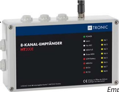
Empfänger HT 200 E Art.Nr.: 1618250

Belegung Empfänger Kanal 1 - 8 (Rel1 - 8)