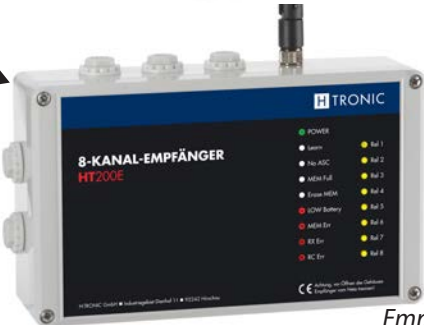
Empfänger HT 200 E Art.Nr.: 1618250